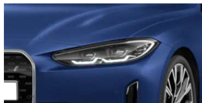
Faro e mascherina anteriore