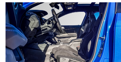
Foto interni visti da portiera aperta