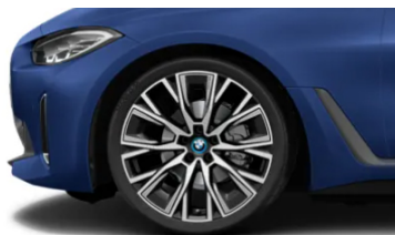
Dettaglio cerchio in lega