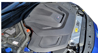
Dettaglio a scelta