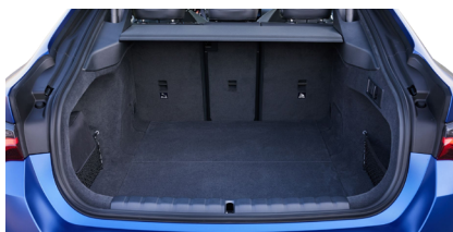
Dettaglio faro e baule posteriore