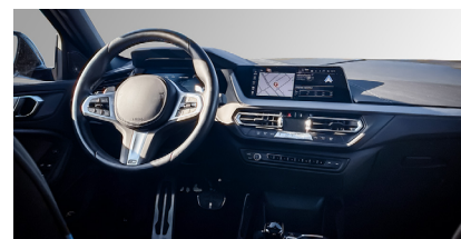
Foto cruscotto visto da passeggero dietro