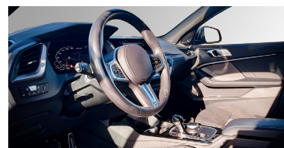
Foto volante e cruscotto viste da lato guidatore (dettaglio volante)