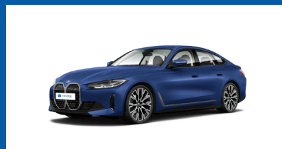
Vista anteriore - angolo 45°