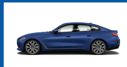
Vista laterale - sinistra