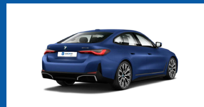
Vista posteriore - angolo 45°