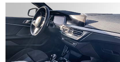
Foto volante e cruscotto vista lato passeggero