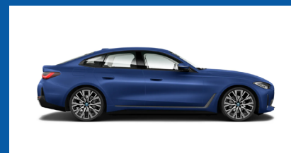
Vista laterale - destra